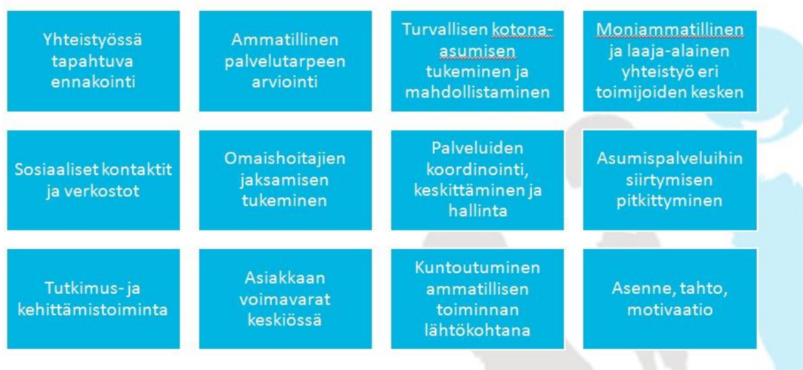
Kuvio 2. Asiakasohjauksen ja avopalveluiden toiminnan painopisteet

Laki ikääntyneen väestön toimintakyvyn tukemisesta sekä iäkkäiden sosiaali- ja terveystal- veluista (2013) mukaan palvelun tarve on selvitettävä kokonaisvaltaisesti. Soitessa selvitys palveluntarpeesta tehdään aina yhteistyössä iäkkään henkilön ja tarvittaessa myös hänen lä- heistensä ja omaistensa kanssa.